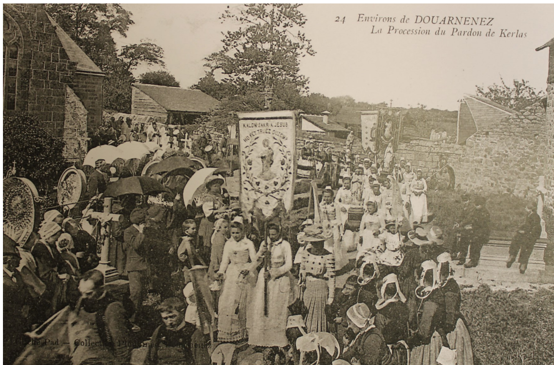
24 Environs de DOUARNENEZ La Procession du Pardon de Kerlaz